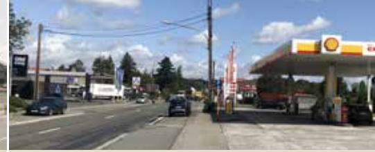
Nieuwe belasting slecht voor milieu en mobiliteit (p. 3)