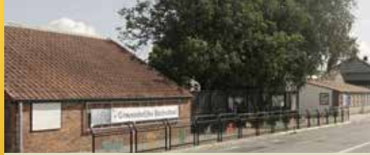
Onzekere toekomst De Kiem-Lombeek (p. 2)