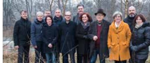
E40 Essene en Lombeek verbonden in 2018 p. 3