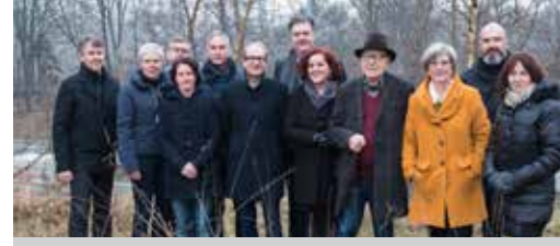
E40 Essene en Lombeek verbonden in 2018 p. 3