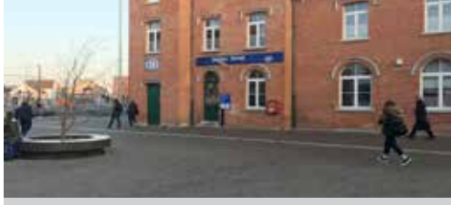
Stationsomgeving Ternat, een mager resultaat p. 2