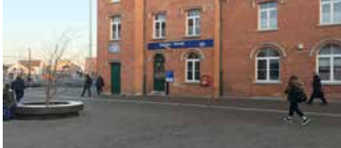
Stationsomgeving Ternat, een mager resultaat p. 2